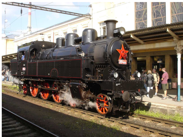
Parní vlaky poveze po oba dny: 354.195 s vozy Bai

Prodej jízdenek u vlakového personálu!!!!